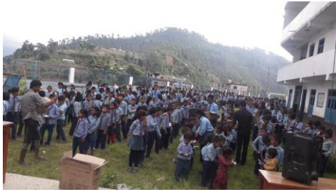
P16 WASH・衛生キットを受けているイルク高等学校の生徒