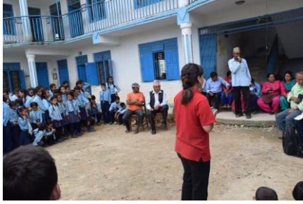
P8 教育委員会の委員が意見を述べている