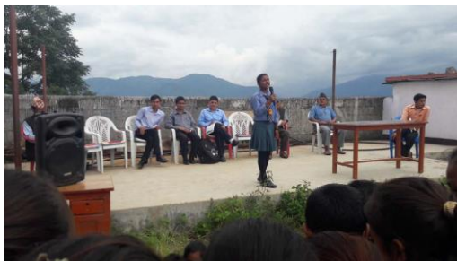
P18 口頭発表競技にて発表しているイルク高等学校での生徒