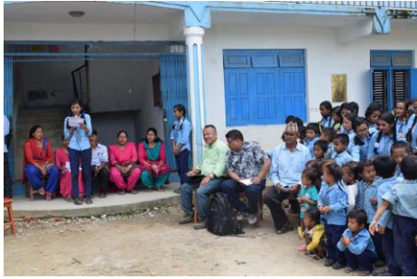
P9 WASH・衛生と栄養に関する感想文競技で発表をしている生徒