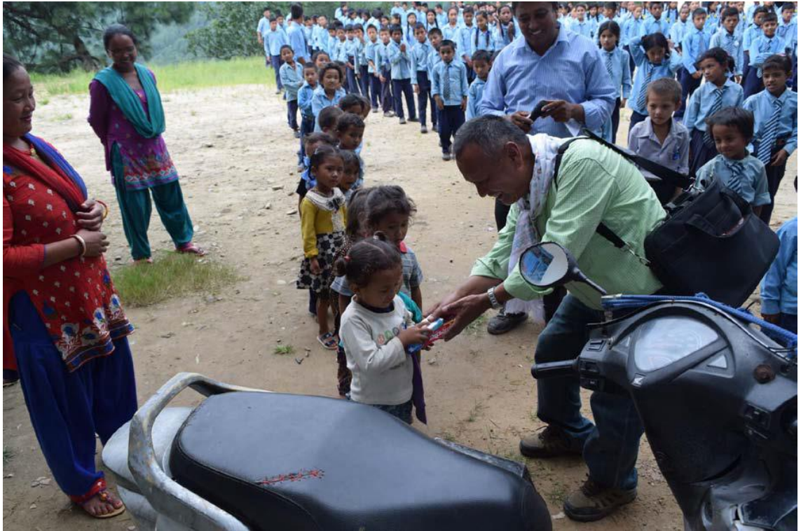
P2 WASH の配布