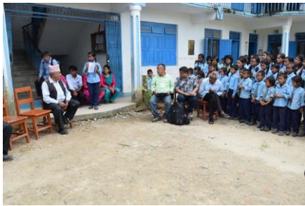
P11 WASH・衛生教育に参加している生徒